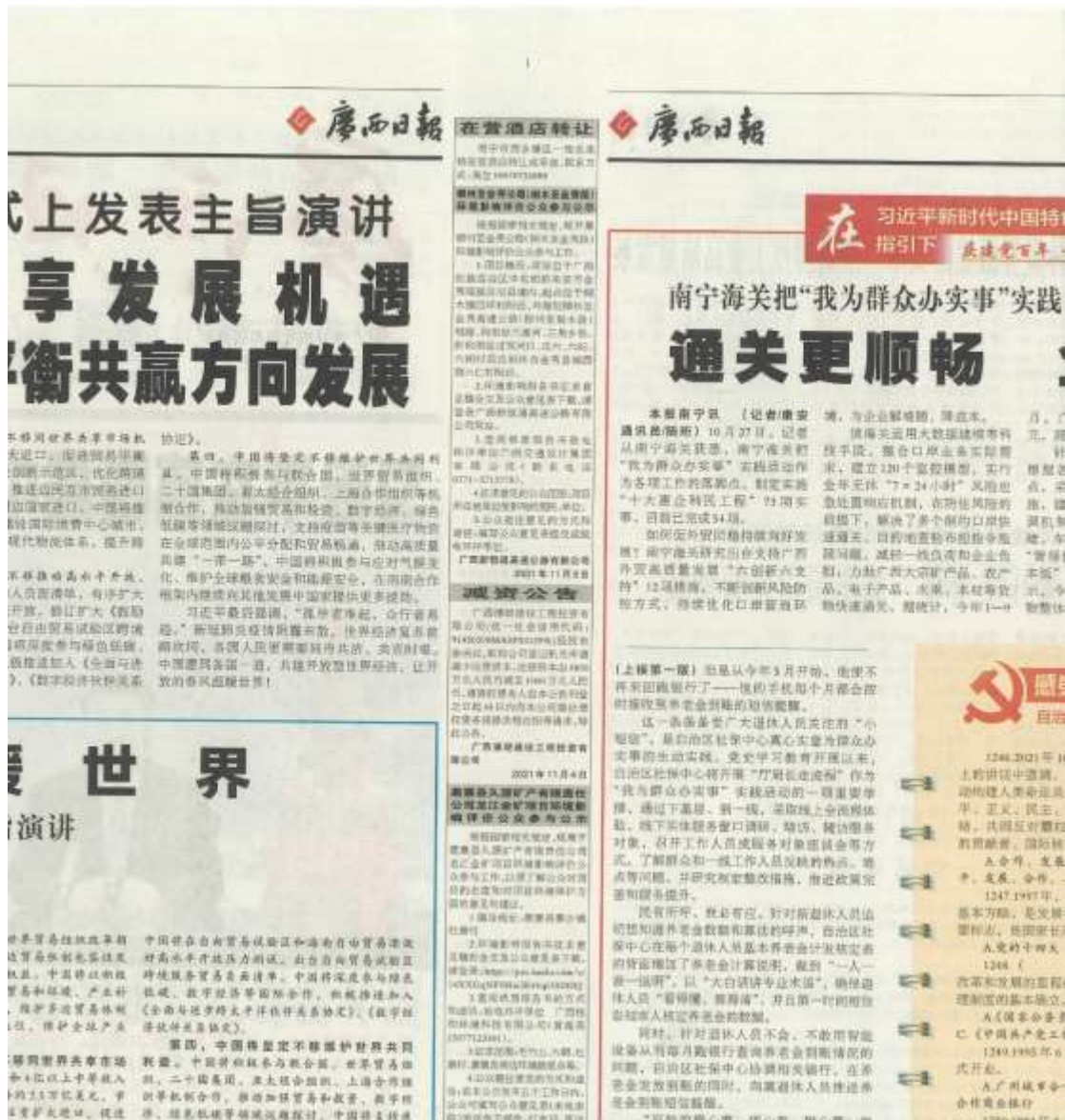
图4 本项目环境影响报告书征求意见稿登报公示照片（第2次）