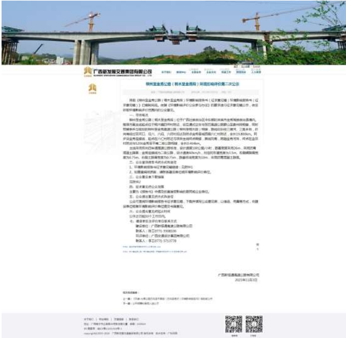
图2 本项目环境影响报告书征求意见稿网上公示截图