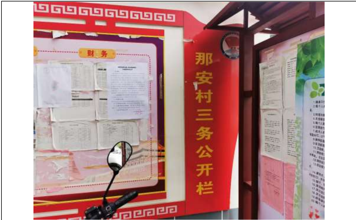
那安村现场张贴（远景）

我单位于2020年11月5日在本项目所在地的那安村、三角乡（村）、金田村等村屯现场张贴了公告，张贴公告的现场照片见图5。