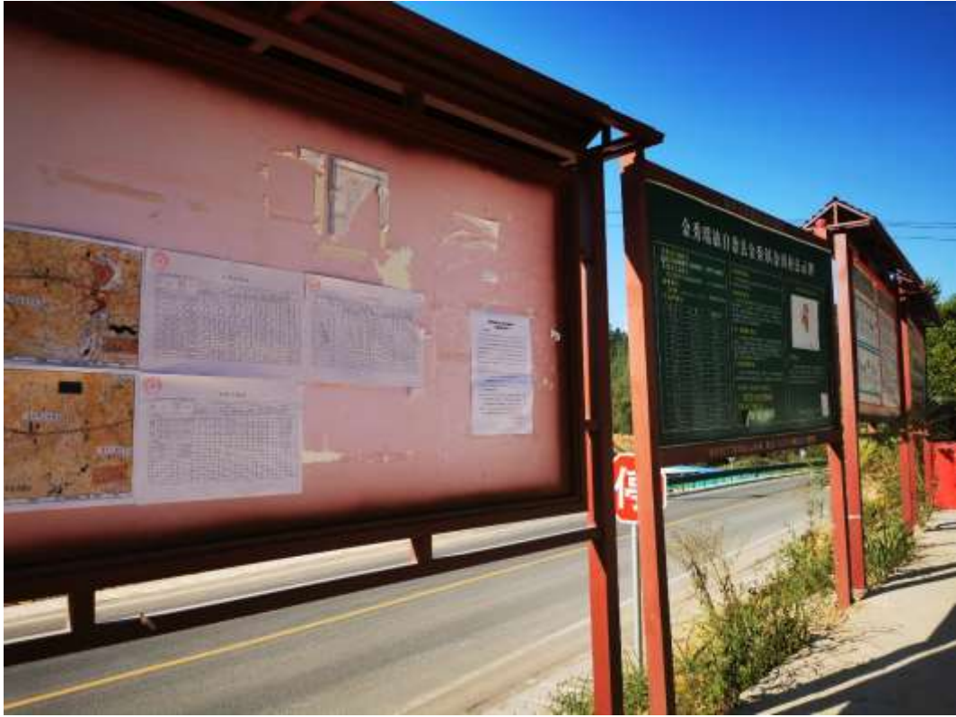
金田村现场张贴（远景）