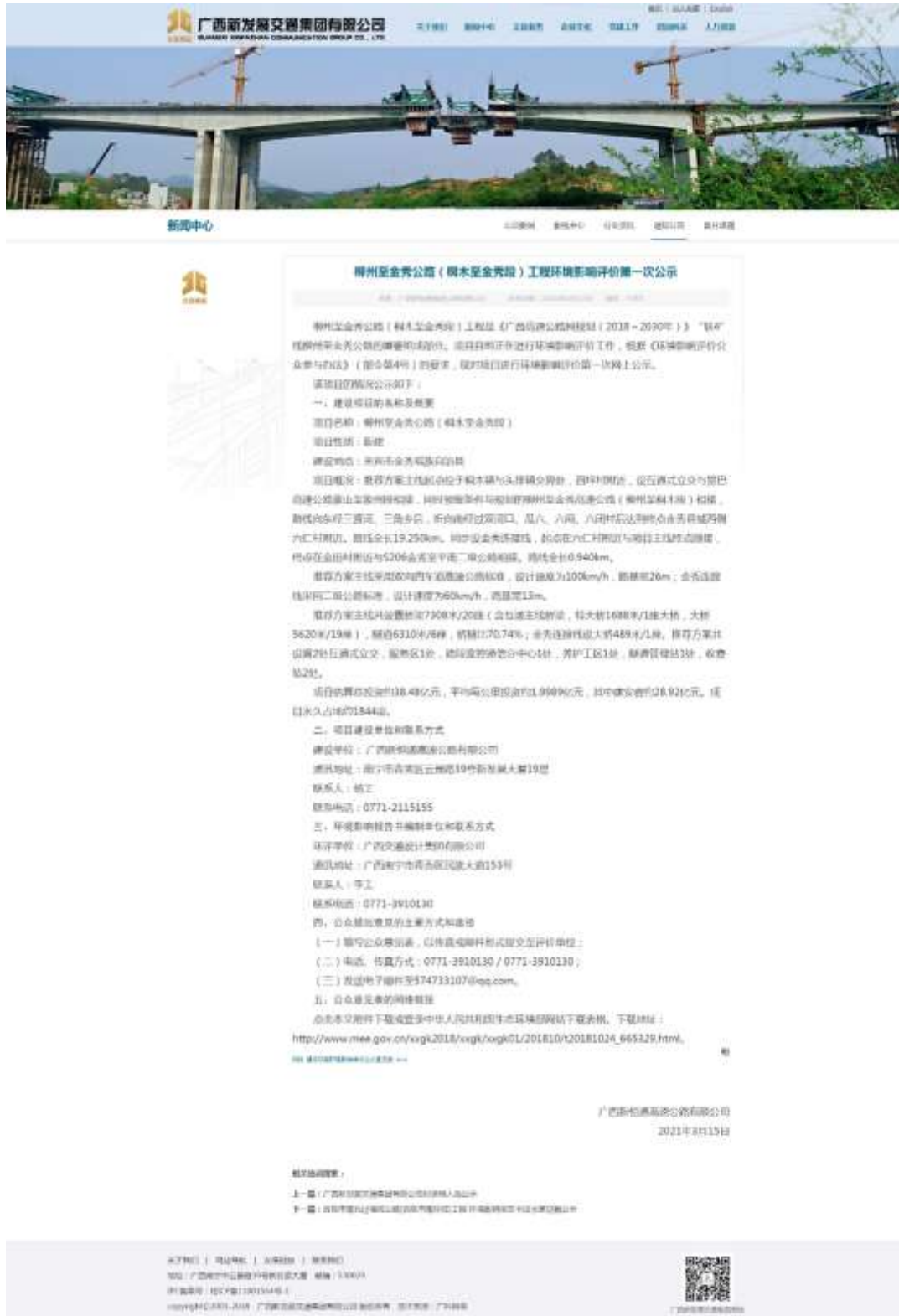
图1 本项目首次环境影响评价信息网上公开截图

广西新发展交通集团有限公司全资子公司)上公开了本项目的首次环境影响评价信息(网址http://www.gxxfz.com/index.php?m=content&c=index&a=show&catid=20&id=4452),公开信息截图见图1。