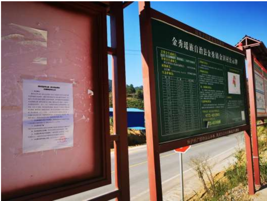
金田村现场张贴（近景）