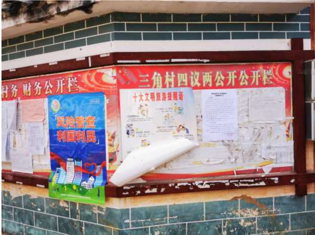
三角乡（村）现场张贴（远景）