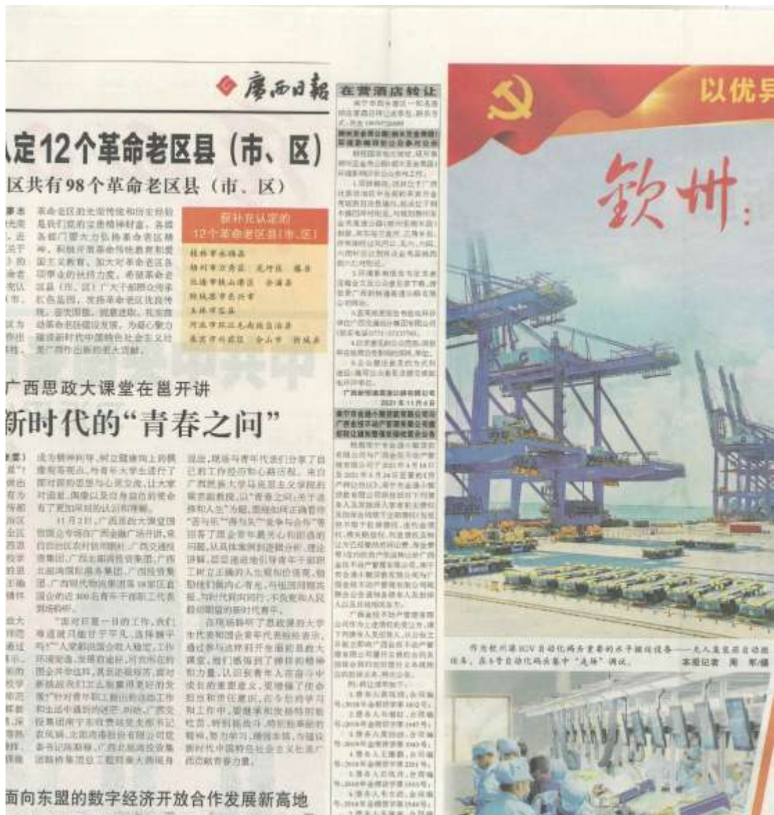
图3 本项目环境影响报告书征求意见稿登报公示照片（第1次）